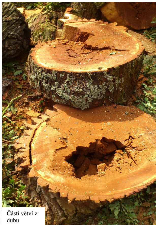
Části větví z dubu